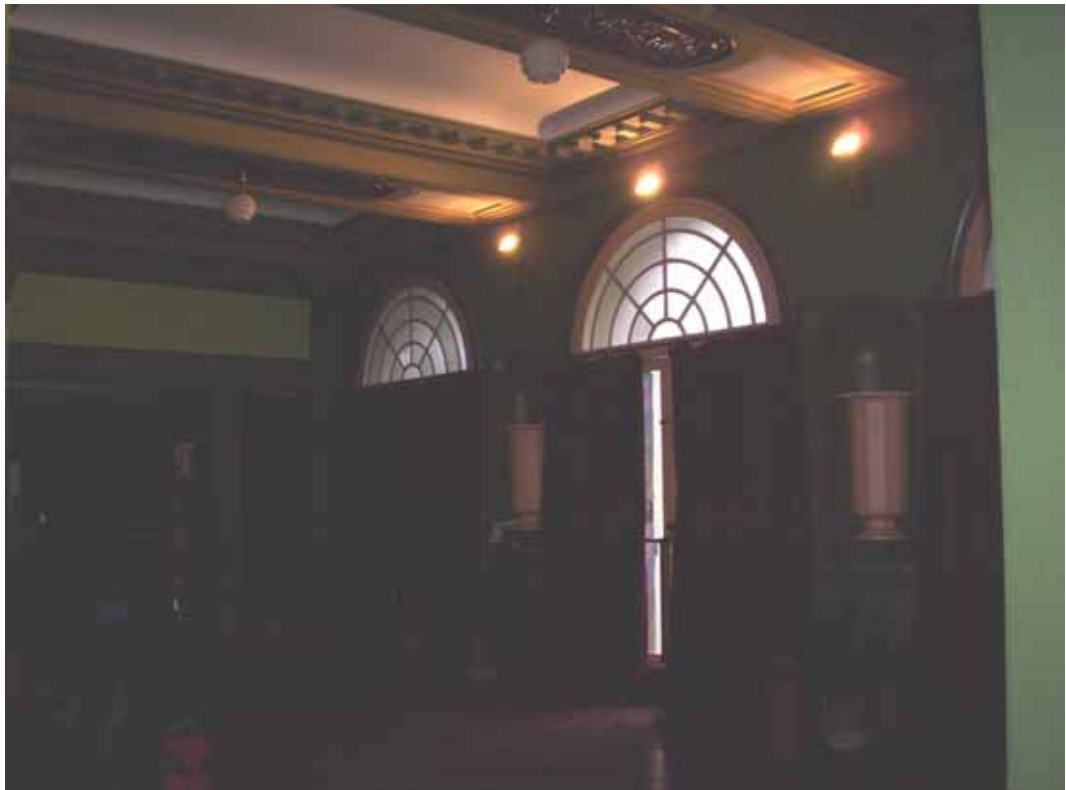
HALL Y PUERTA DE ENTRADA PRINCIPAL. PLANTA BAJA