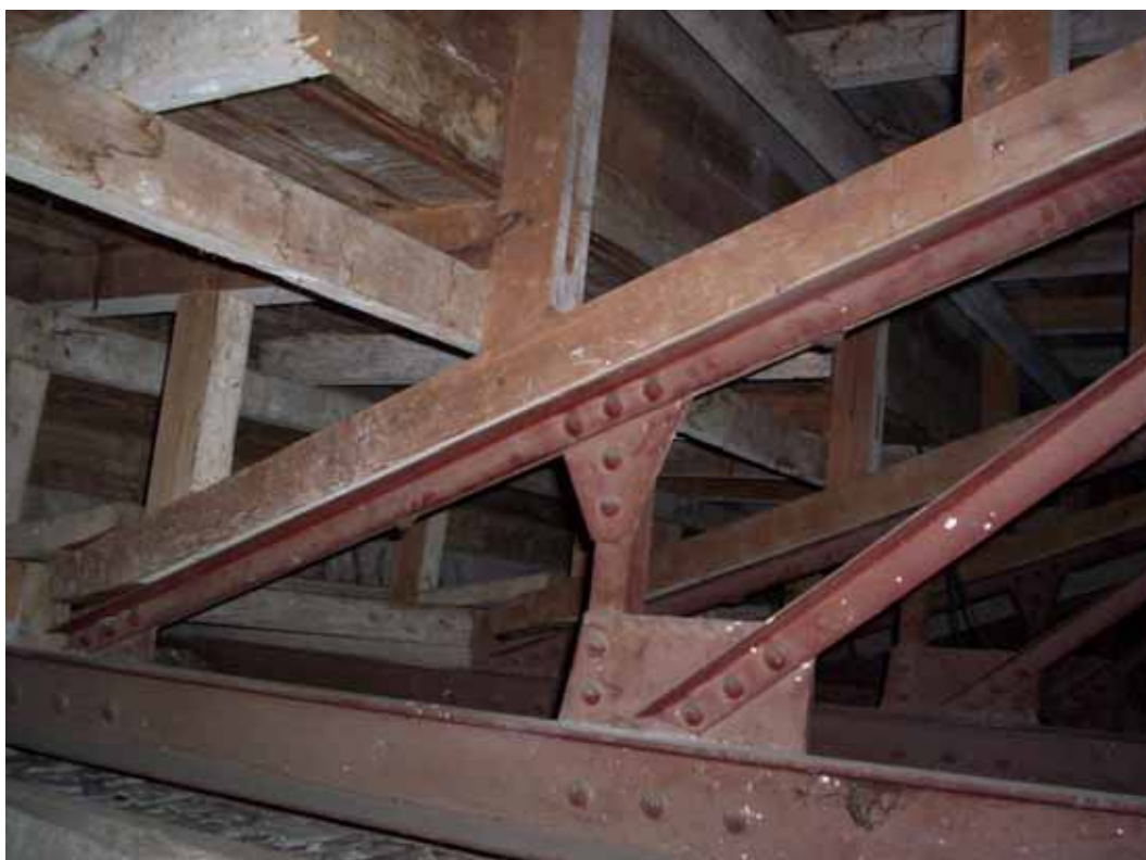
DETALLE DE PERFILES DEL VUELO QUE NO CUMPLEN EN EL CALCULO REALIZADO