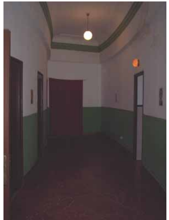
PASILLO LATERAL DERECHO. PLANTA BAJA