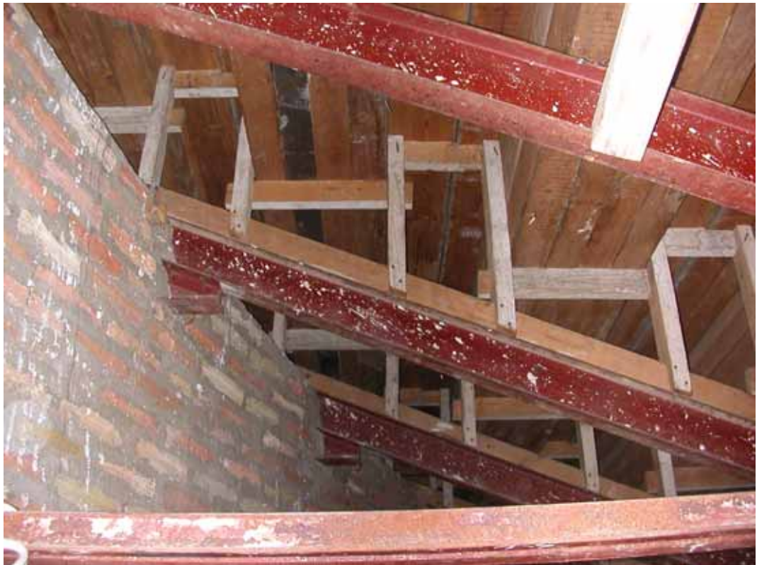
DETALLE DE APOYO DE GRADAS EN PERFIL IPN