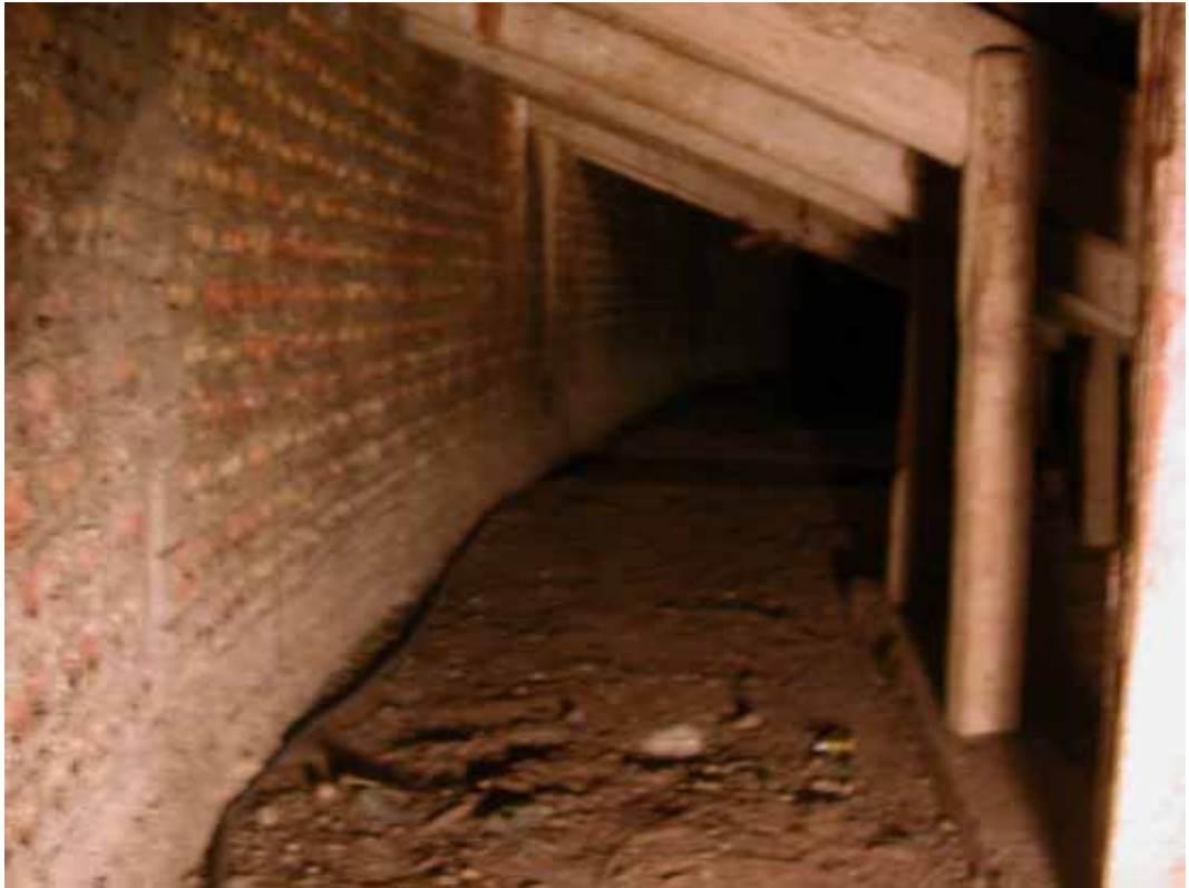
ESTRUCTURA AUXILIAR DE MADERA