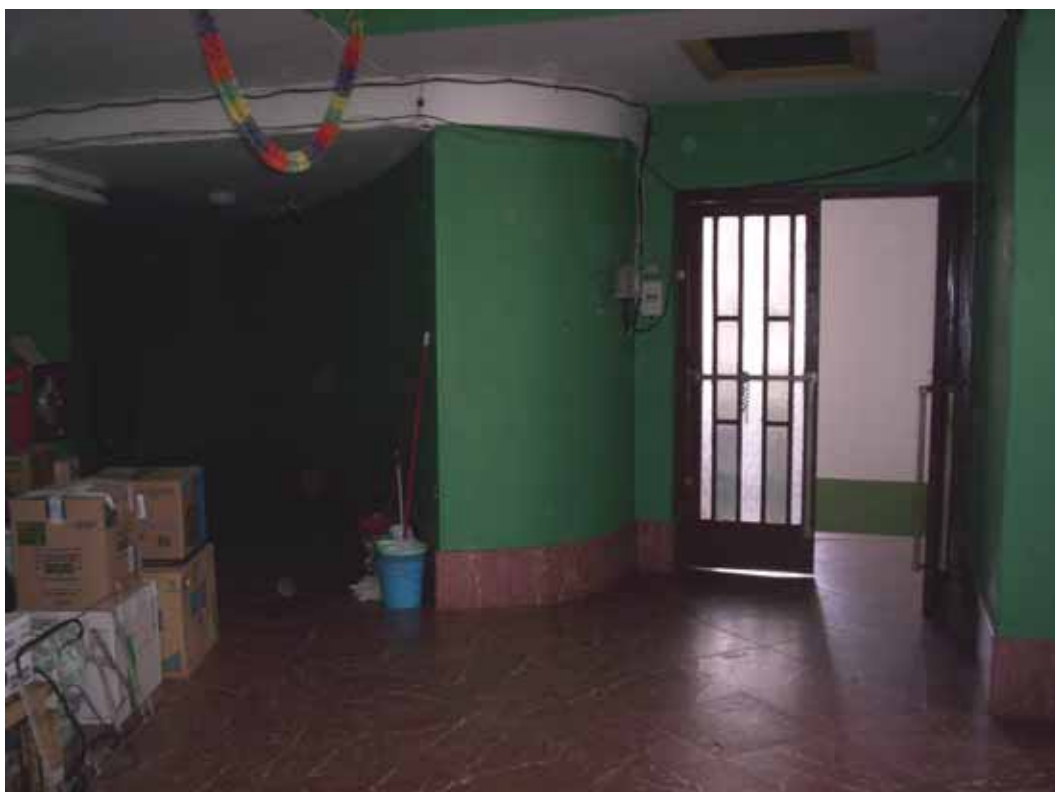
PASILLO LATERAL DERECHO. PLANTA PRIMERA