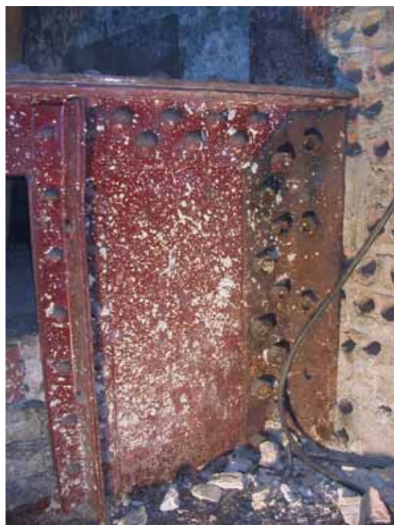
VIGA DE CELOSIA N° 1 (VC-1)