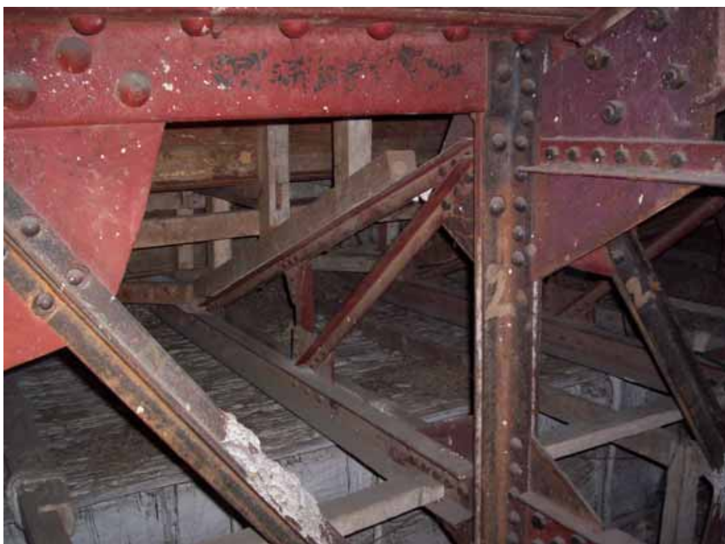
VUELO EXTREMO EN ZONA CENTRAL DEL ANFITEATRO