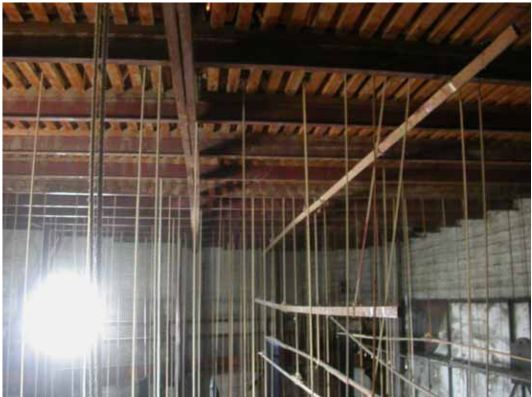
ESTRUCTURA QUE RECOGE EL PEINE