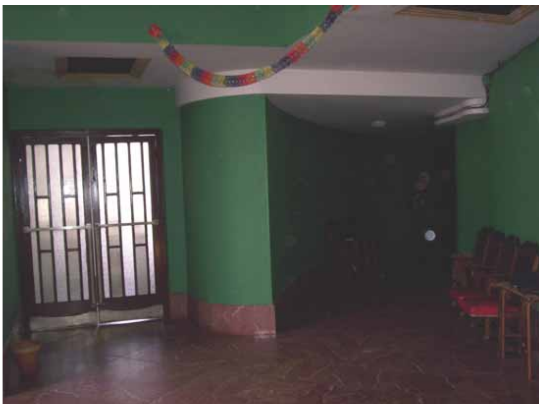
PASILLO LATERAL IZQUIERDO. PLANTA PRIMERA