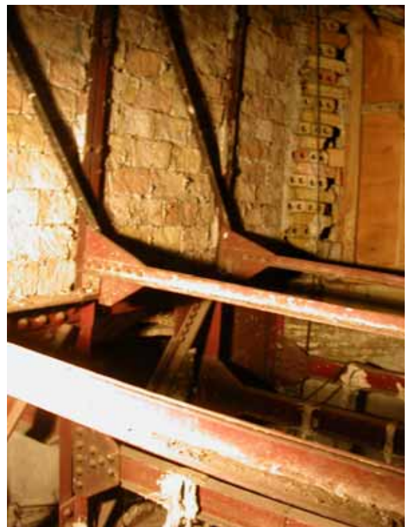
DETALLE DE UNION DE ESTRUCTURA