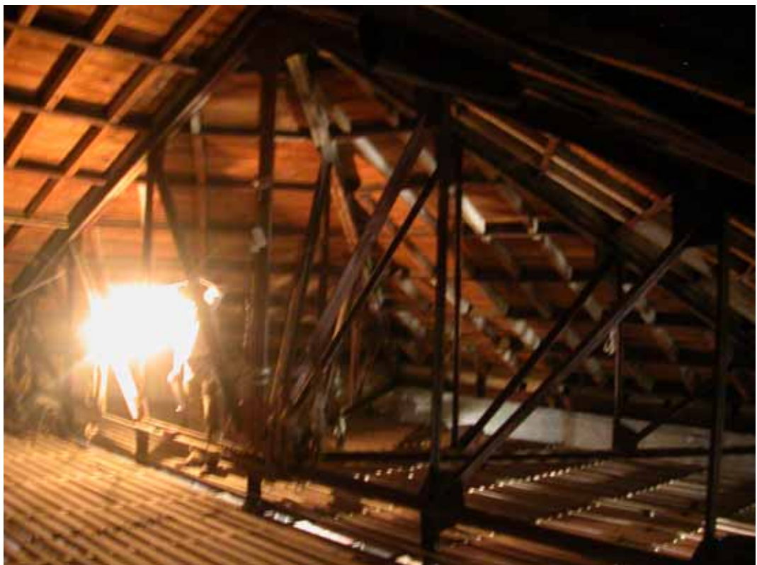
ESTRUCTURA CUBIERTA POSTERIOR (CT-9)