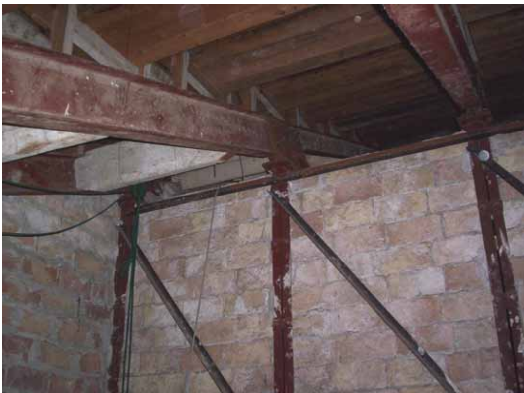
DETALLES DE UNIONES DE LA ESTRUCTURA METALICA