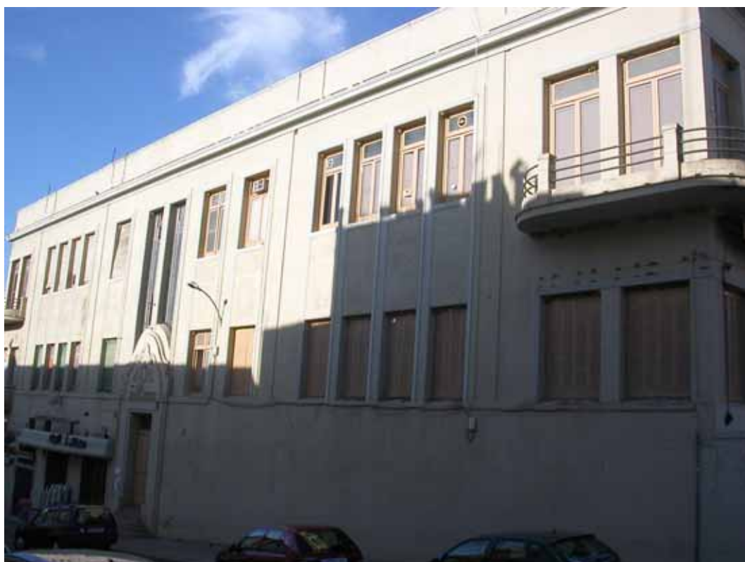
FACHADA POSTERIOR (PEÑA SEVILLISTA, PEÑA GIRALDILLA Y CAFETERIAS)