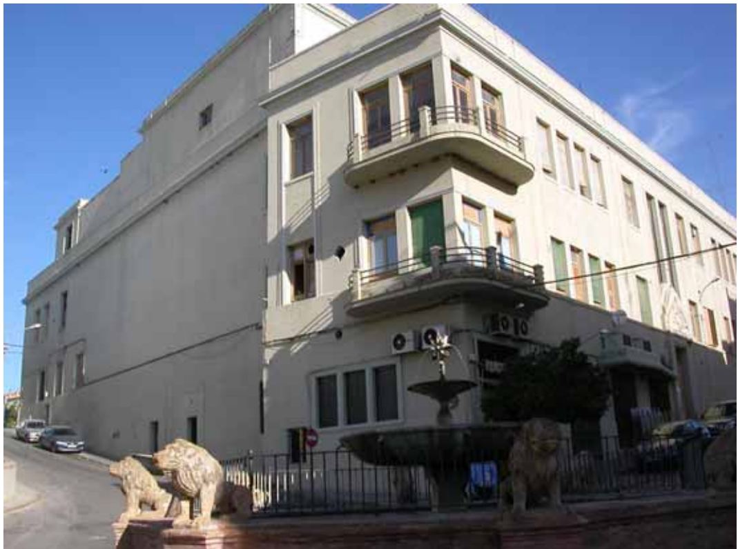
FACHADA LATERAL DERECHA