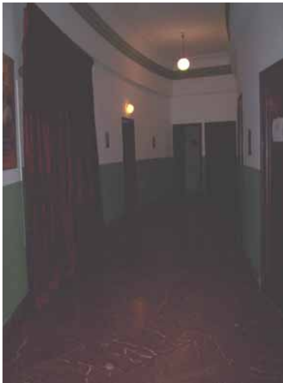
PASILLO LATERAL IZQUIERDO. PLANTA BAJA