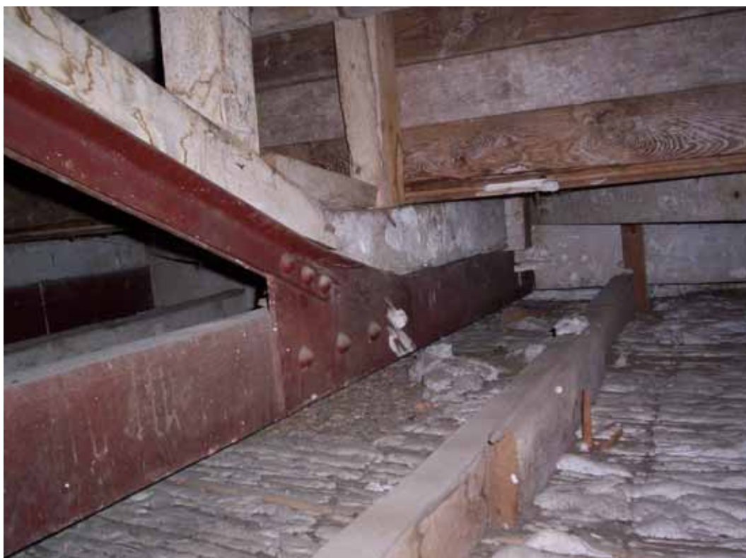
DETALLE DE APOYO DE GRADAS EN EL EXTREMO DEL VUELO