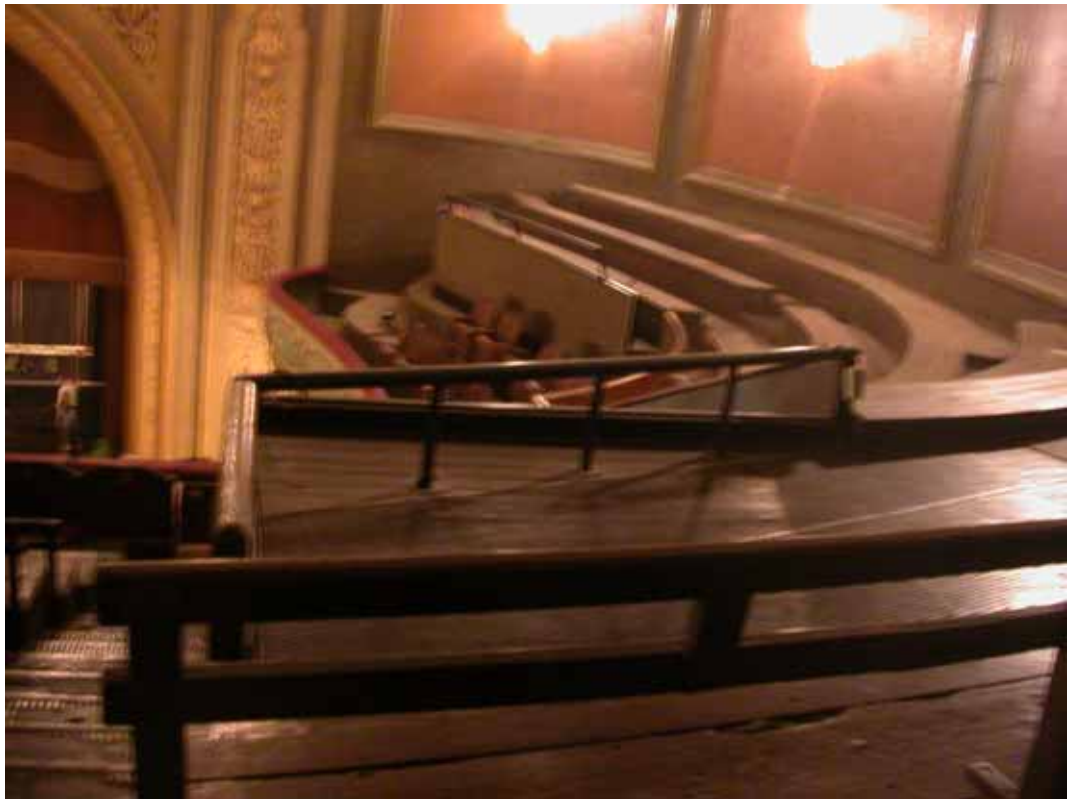
VUELO LATERAL DERECHO