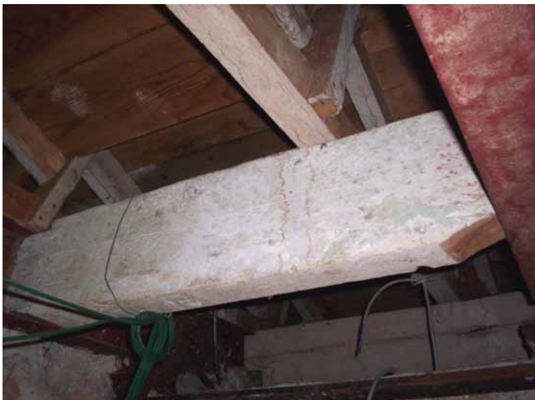
DETALLE DE UNION DE ESTRUCTURA METALICA Y DE MADERA