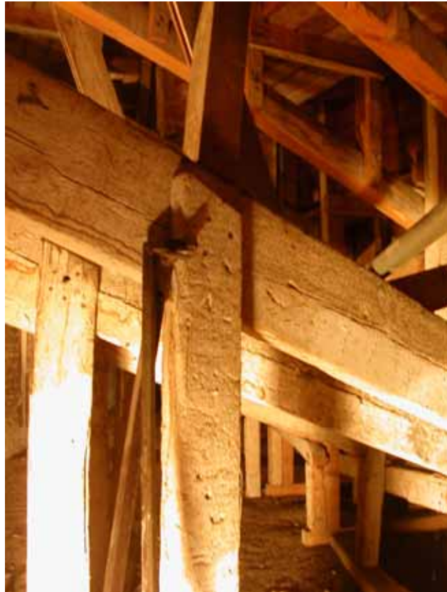
DETALLES DE UNIONES EN ESTRUCTURA AUXILIAR DE MADERA