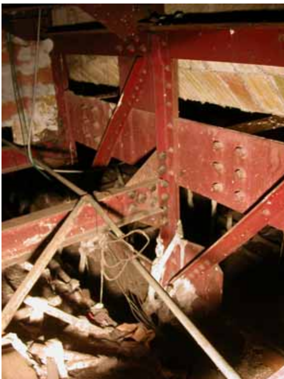
DETALLE DE UNION DE ESTRUCTURA RETICULAR CON VC-2