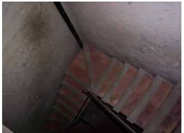
ESCALERA DE ACCESO A PLANTA SEGUNDA