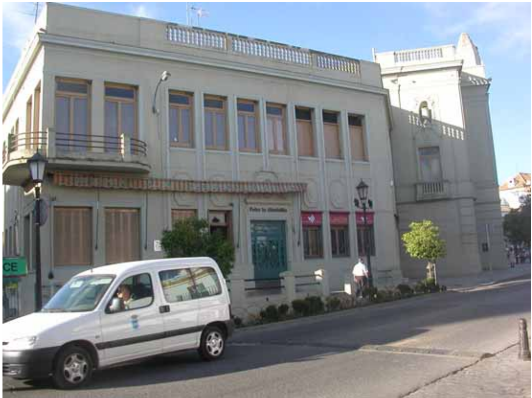
FACHADA LATERAL IZQUIERDA (PEÑA GIRALDILLA Y BANCO)