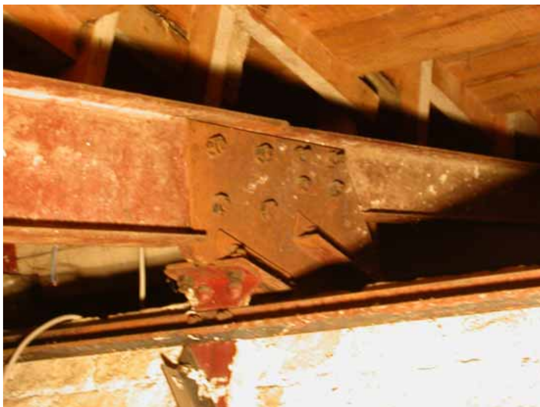
DETALLE DE NUDO SP1 (IPN 140-IPN 200)