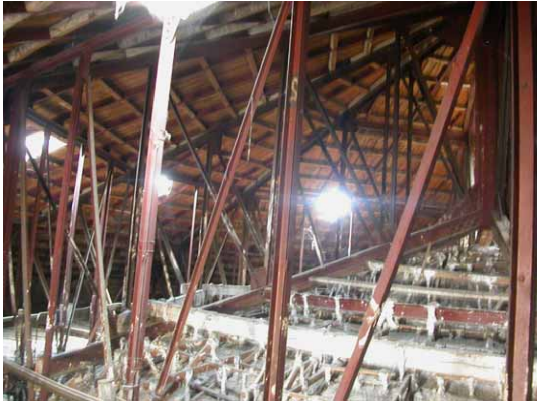
ESTRUCTURA DE CUBIERTA CENTRAL