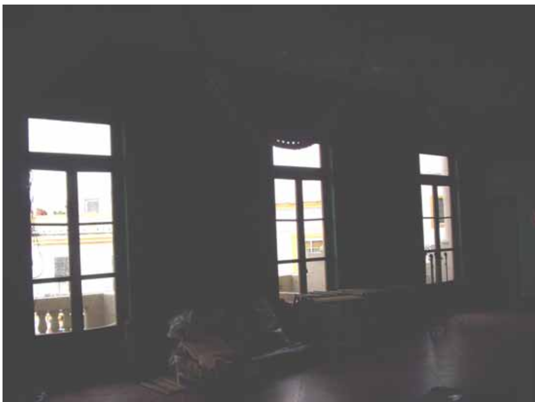
HALL Y BALCONES. PLANTA PRIMERA