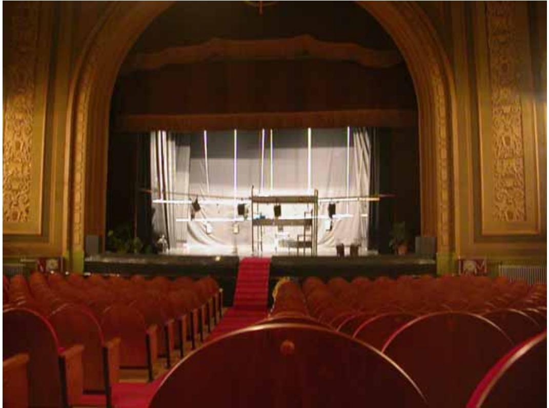
PATIO DE BUTACAS Y ESCENARIO. PLANTA BAJA