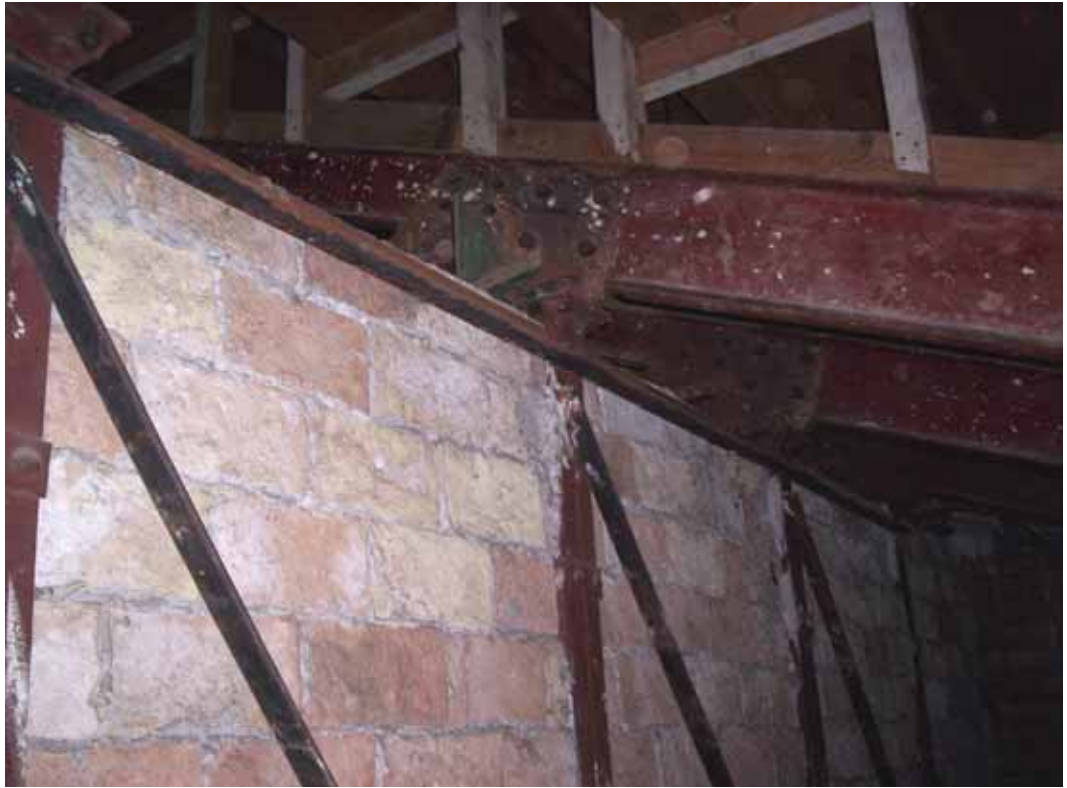
DETALLES DE UNIONES DE LA ESTRUCTURA METALICA