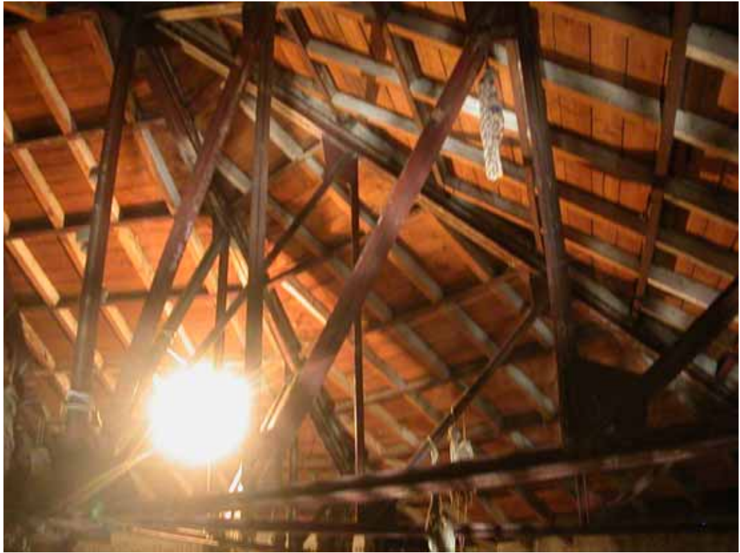
ESTRUCTURA CUBIERTA POSTERIOR (CT-10)