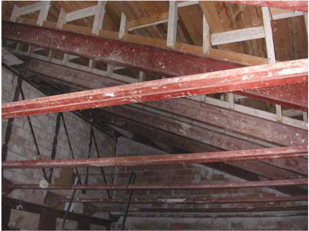
ESTRUCTURA QUE RECOGE EL GRADERIO DE LA ZONA CENTRAL