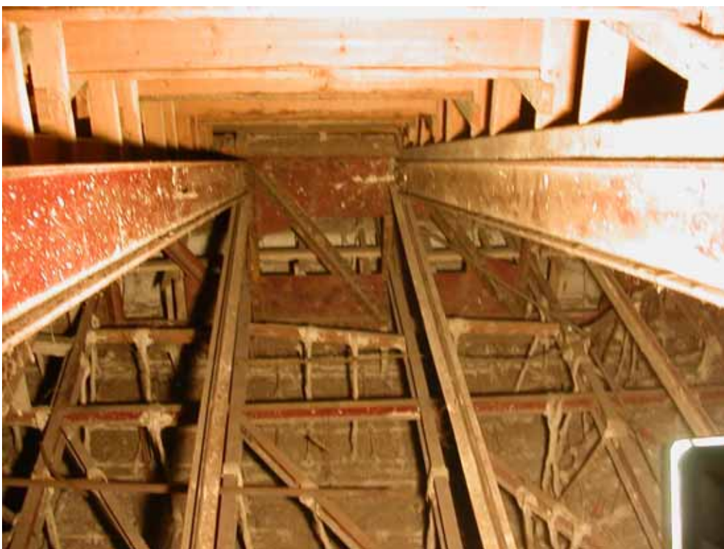
ESTRUCTURA GRADERÍO CENTRAL