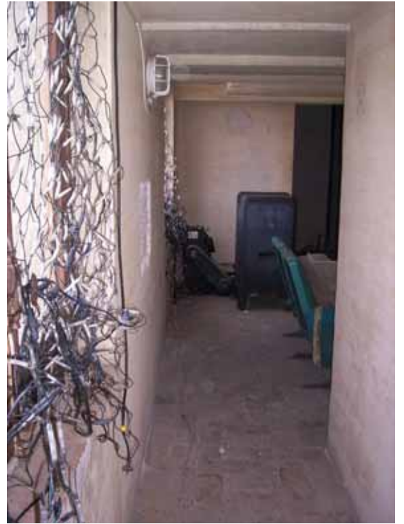
PLANTA SEGUNDA Y ESCALERA DE ACCESO AL PROYECTOR