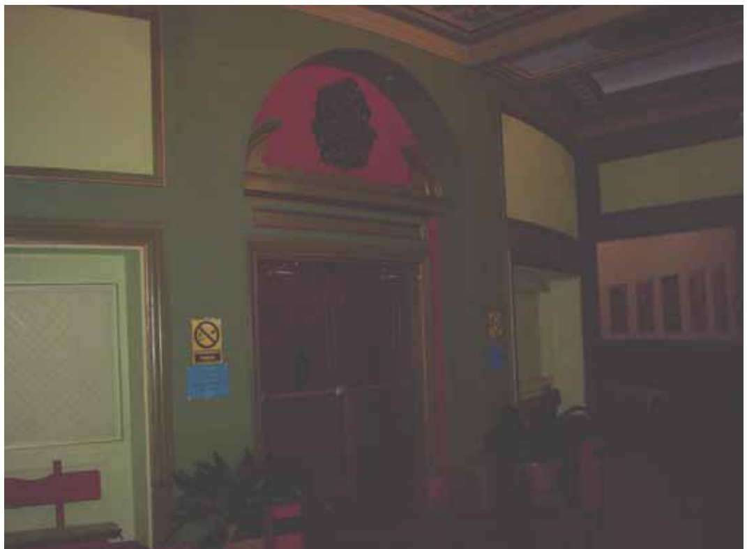
HALL Y PUERTA DE ENTRADA PRINCIPAL AL PATIO DE BUTACAS. PLANTA BAJA