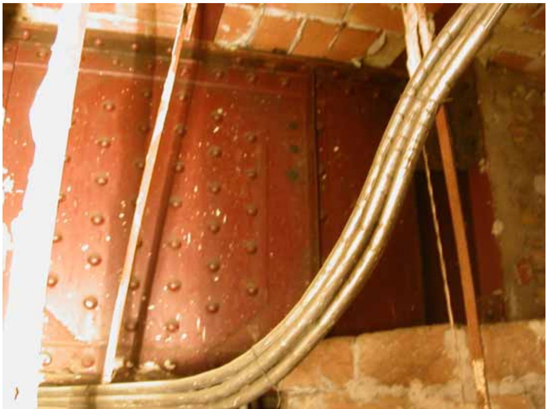
DETALLE DE UNION DE VC-1 A PILAR